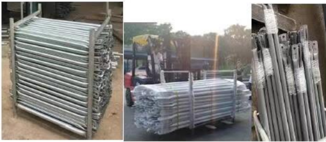
Boja vrućih pocinčanih cijevi je po izboru