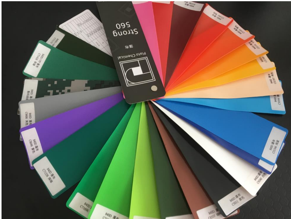
Boje koje možete odabrati za PVC šatorska tkaninu