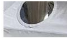
Okrugli transparentni PVC prozor