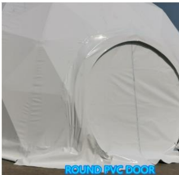
ROUND PVC DOOR