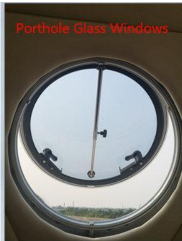
Porthole Glass Windows