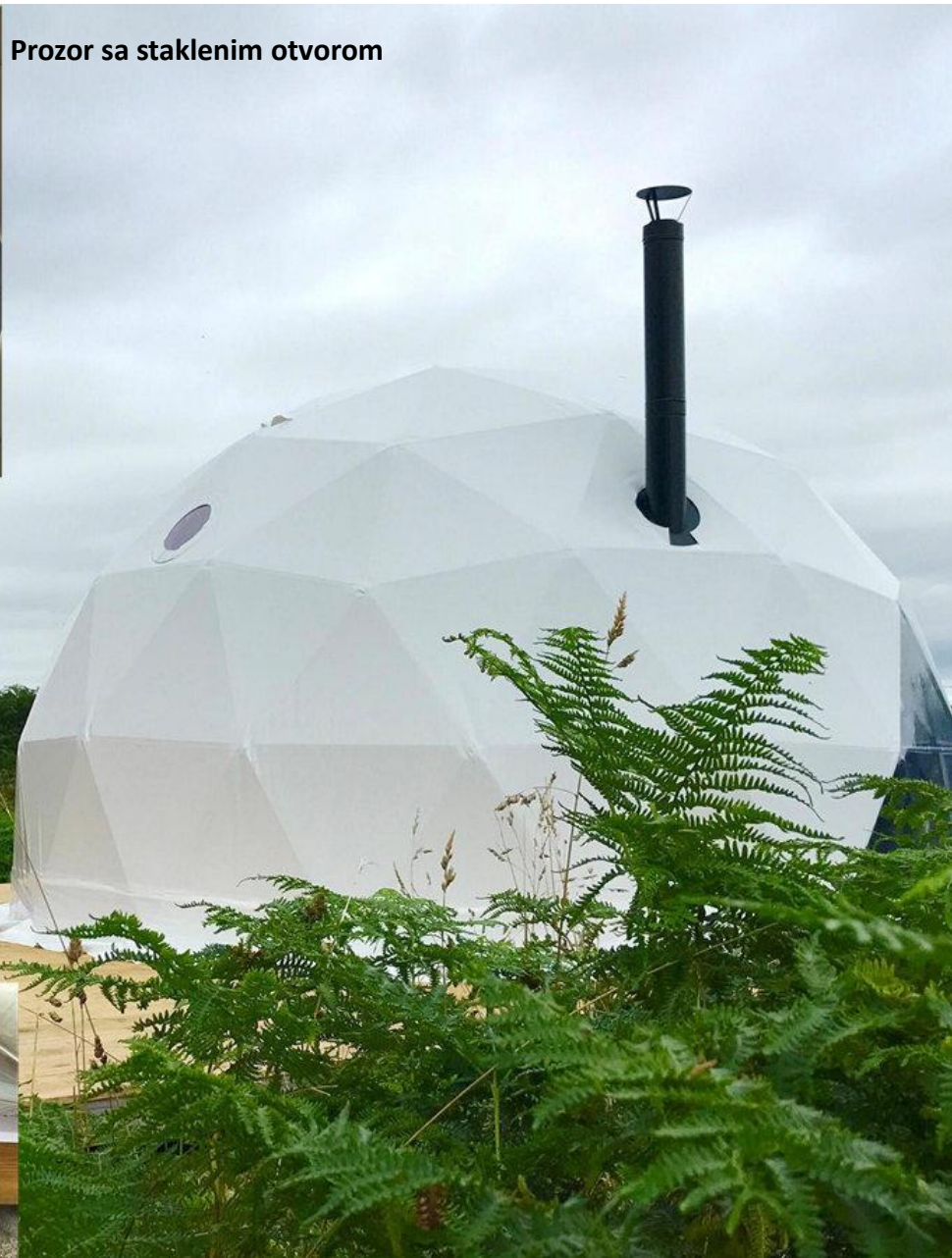
Drvena podna konstrukcija