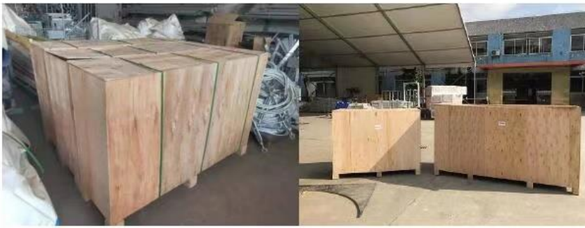
Pakirano u drvenim kutijama radi zaštite od oštećenja