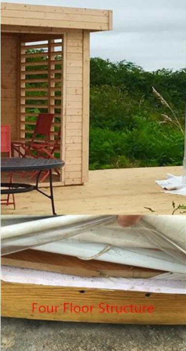
Four Floor Structure