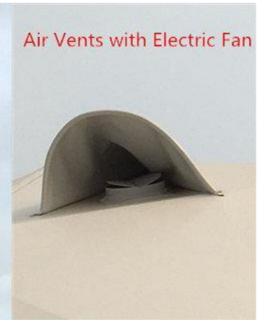
Air Vents with Electric Fan