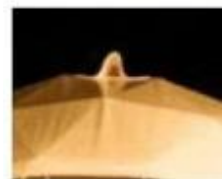
PVC prozor „na uho”