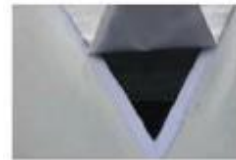
Trokutasti prozor protiv komaraca