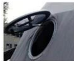
Okrugli stakleni preklopni prozor