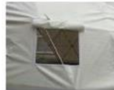
Kvadratni rolo prozor protiv komaraca