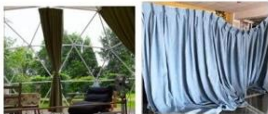
Set zavjesa (boja po izboru)