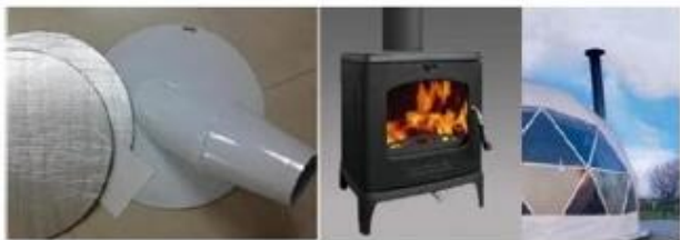
Sistem peći s dimnjakom