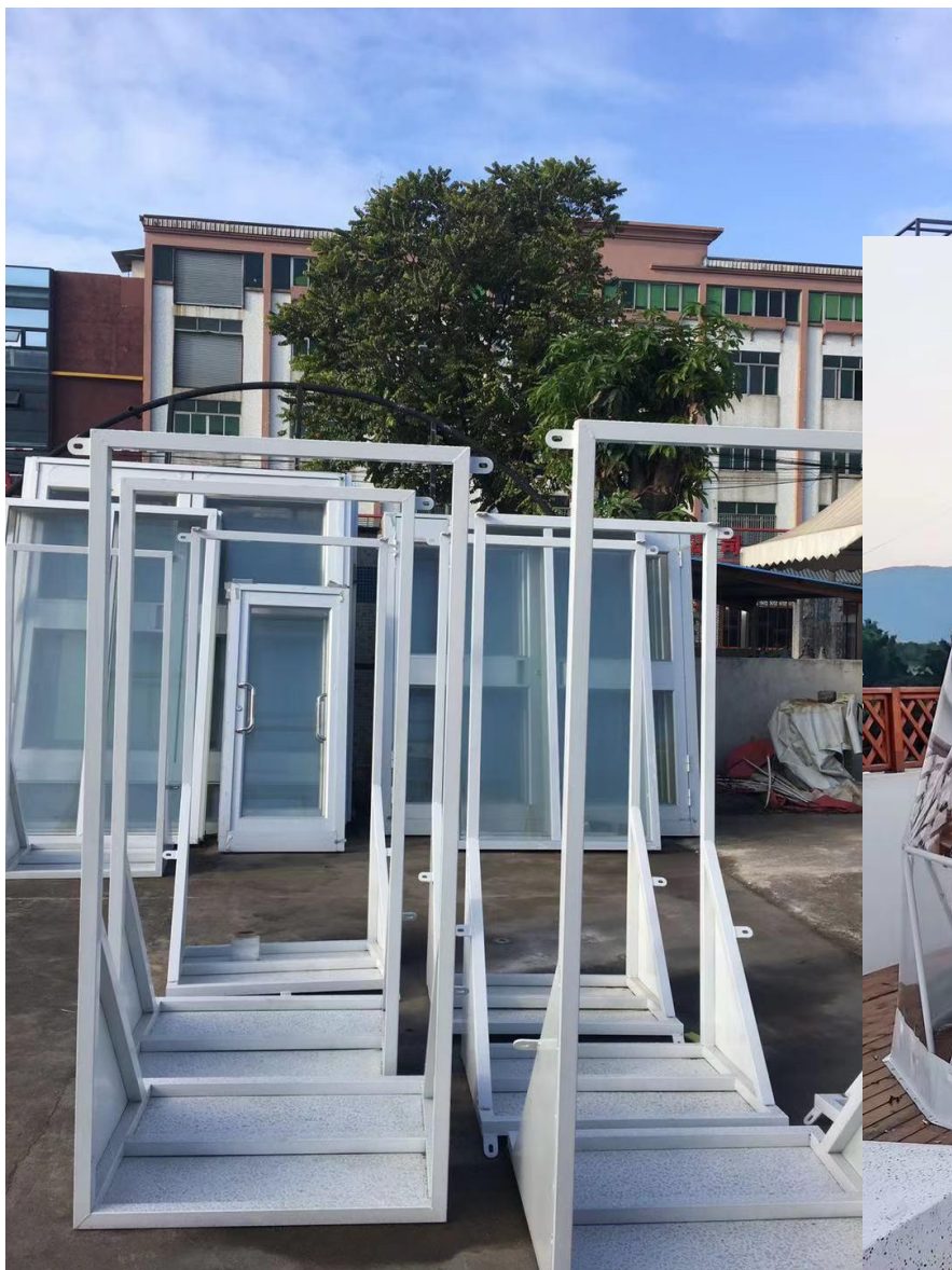
Okvir i vrata na mjeru