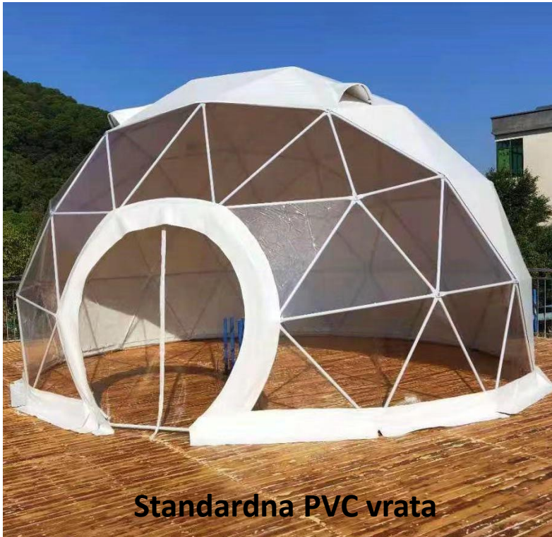
Standardna PVC vrata