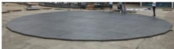
Panel od šperploče s toplim pocinčanim okvirom