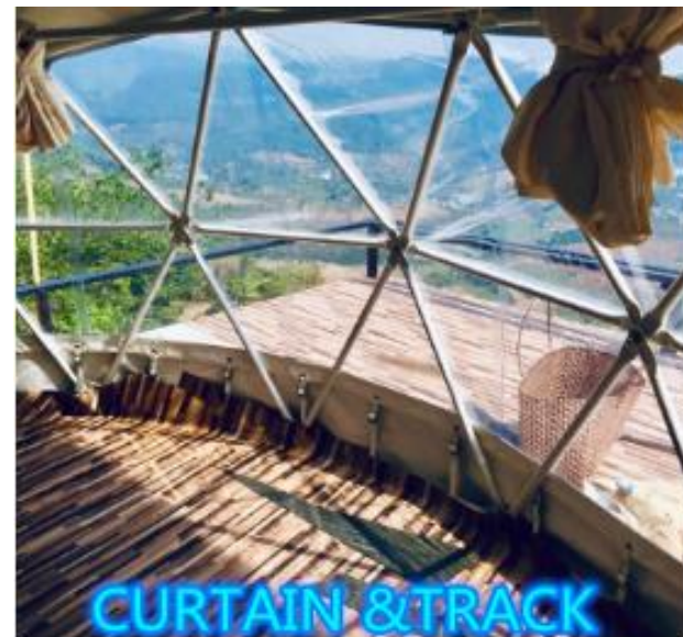
CURTAIN & TRACK