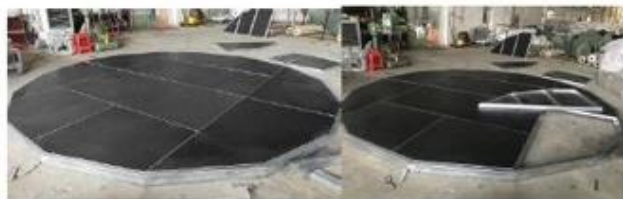
Pod od šperploče