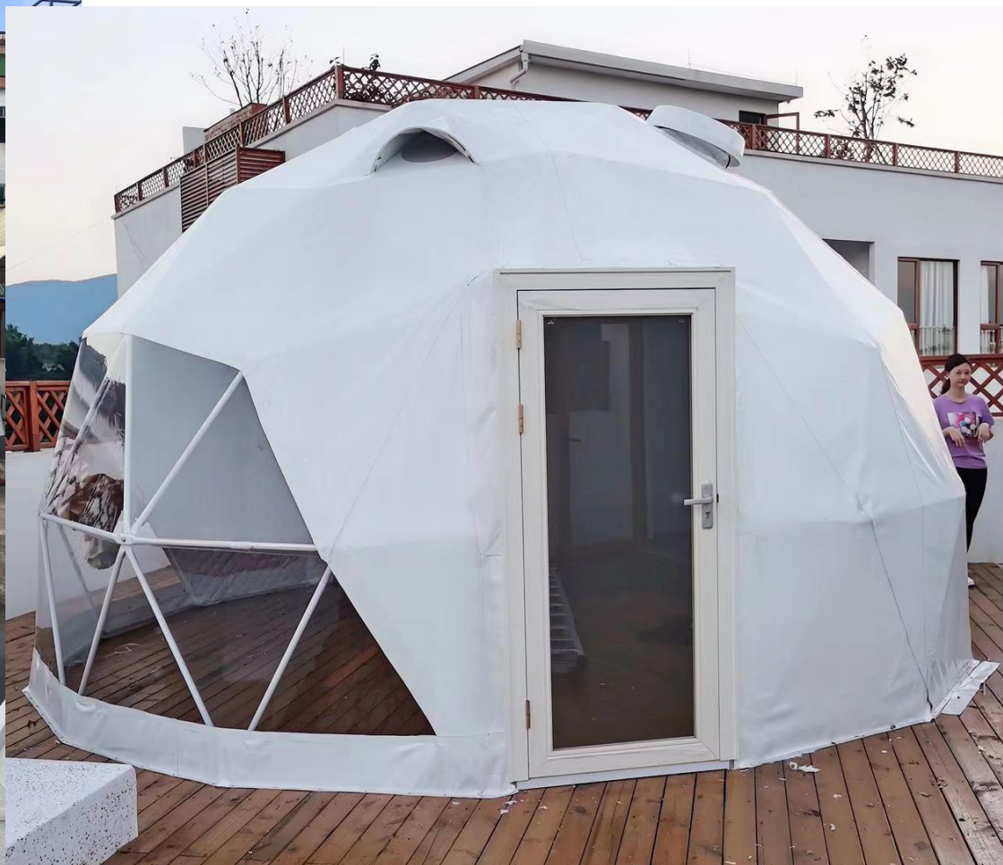
Kupola s vratima i okvirom na mjeru