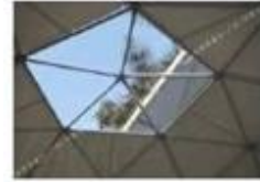
Krovni transparentni prozor