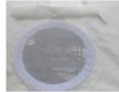
Okrugli preklopni PVC prozor + mrežica