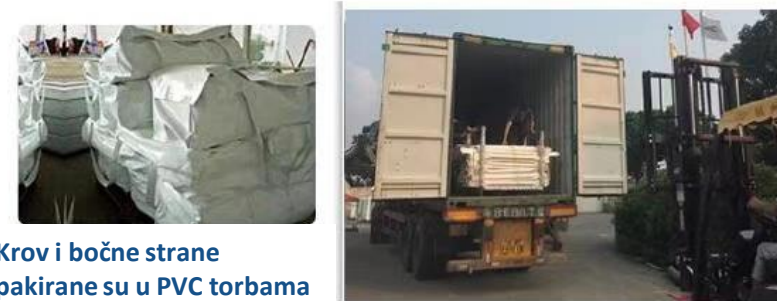
Krov i bočne strane pakirane su u PVC torbama